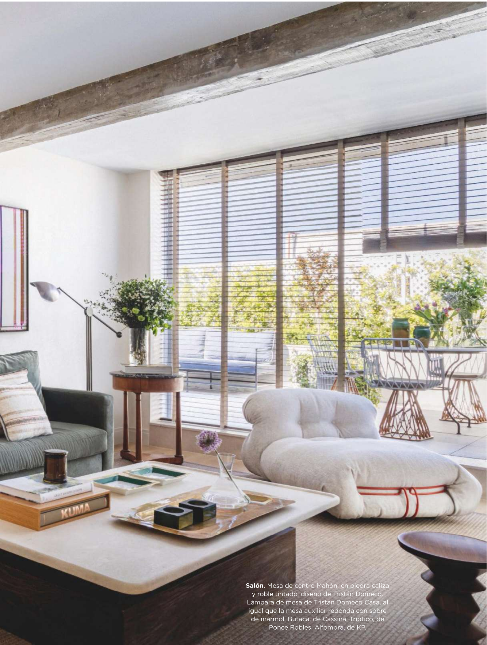
Salón. Mesa de centro Mahón, en piedra caliza y roble tintado, diseño de Tristán Domecq. Lámpara de mesa de Tristán Domecq Casa, al igual que la mesa auxiliar redonda con sobre de mármol. Butaca, de Cassina. Tríptico, de Ponce Robles. Alfombra, de KP.